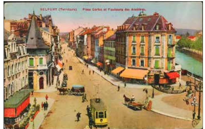
H. Adain, Belfort – Archives municipales de Belfort.

Renseignements et réservation au 03 84 54 25 44