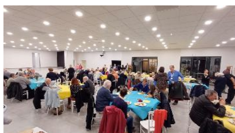
Le repas de gala