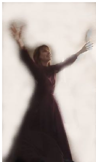
Passage du Bourdon