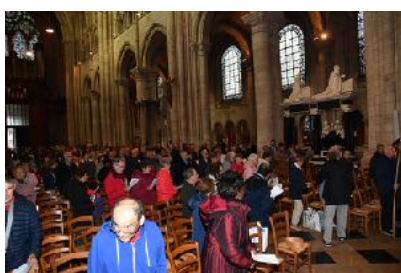
Cathédrale saint Étienne de Sens