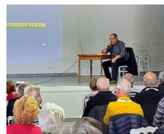
Historien Iconographe de saint Jacques dans l'Yonne