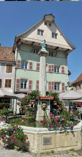
La Fontaine Mazarin