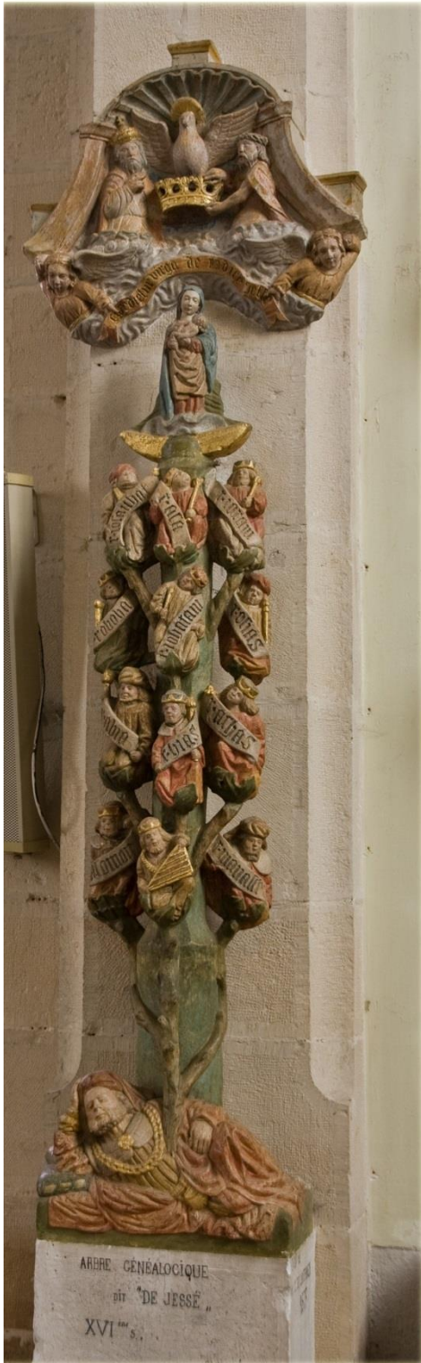
L'Arbre de JESSE