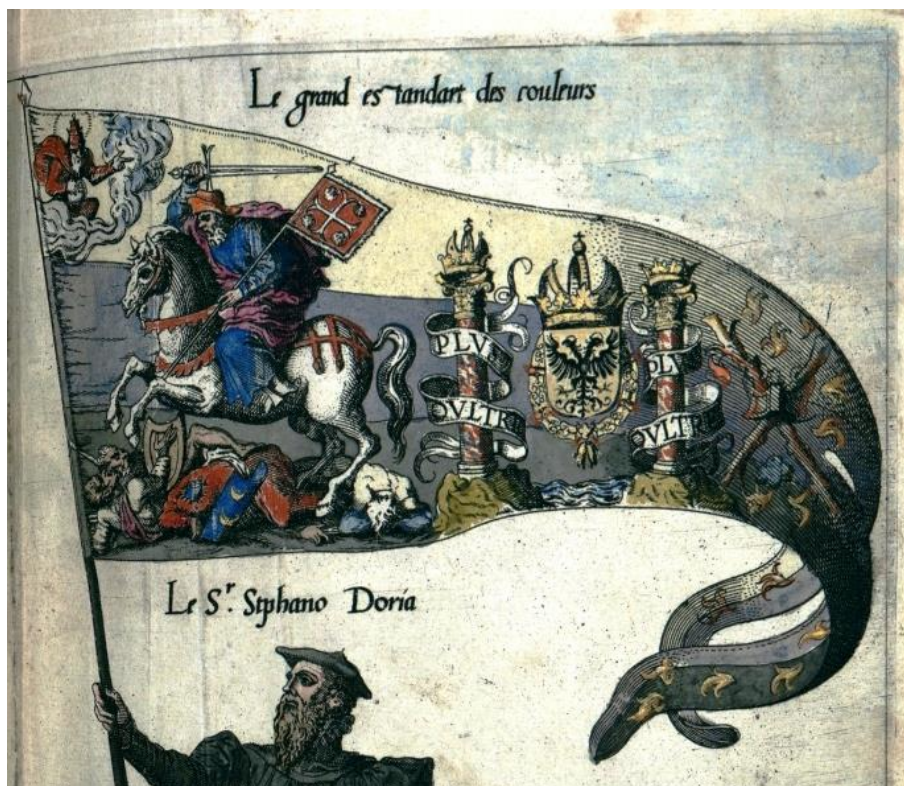
Grand étendard de Charles Quint, Besançon, Bibliothèque Municipale

Compostelle et saint Jacques ont ainsi été présents dans l'imaginaire européen depuis le XIIe siècle. Cette présence dans l'imaginaire a été renforcée par l'expérience pèlerine, de ceux qui sont allés à Compostelle et de tous ceux qui ont vénéré saint Jacques dans l'un ou l'autre des innombrables sanctuaires qui possédaient une de ses reliques. Longtemps, la multiplicité des reliques d'un même saint n'a étonné personne. Elles passaient pour authentiques, même aux esprits les plus cultivés. Saint Jacques possède un don d'ubiquité : des corps à Toulouse, Angers ou Echirolles, des reliques à Liège, Canterbury, Pistoia, Aix-la-Chapelle, Paris, on n'en finit pas de recenser les lieux qui ont attiré pèlerins.