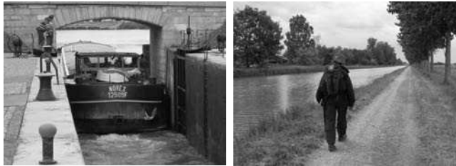
Écluse et chemin de halage du canal de Bourgogne

Des renseignements complémentaires sur les hébergements peuvent être obtenus auprès de la Confraternité des Pèlerins de Saint-Jacques en Bourgogne : E-mail : confraternite@st-jacques-bourgogne.org , Internet : www.st-jacques-bourgogne.org