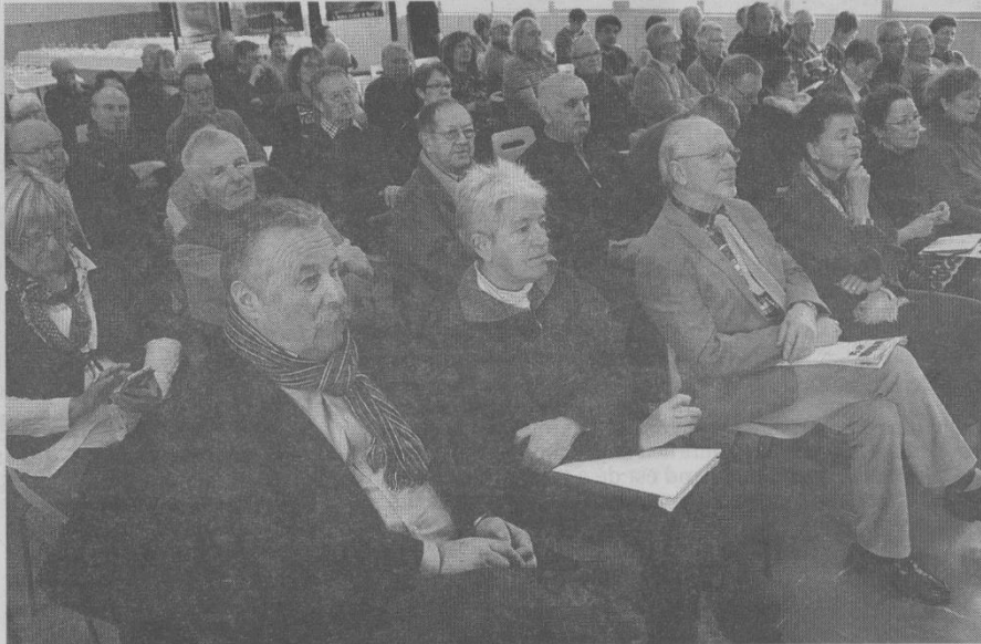
Une belle assistance pour cette assemblée générale régionale.

L'assemblée générale régionale du Chemin de Compostelle a eu lieu samedi, non loin d'un chemin d'étape.