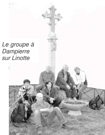
Le groupe à Dampierre sur Linotte

« Notre groupe familial Schoenfeld de la communauté catholique de Bissingen a commencé il y a un an et demi un pèlerinage devant le conduire à St Jacques de Compostelle. C'est en Franche-Comté que nous avons cheminé en avril 2006.