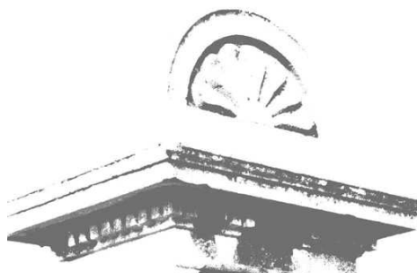
Fontaine à Corcelles

Depuis le début de l'année, randonneurs et pèlerins se retrouvent un dimanche par mois sur le chemin de Compostelle en Franche-Comté.