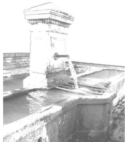
La fontaine de Grammont